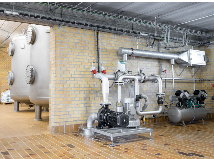
Kompletné riešenie úpravy vody obsahujúce tlakový filter a technologické zariadenie na oxidáciu a preplach.