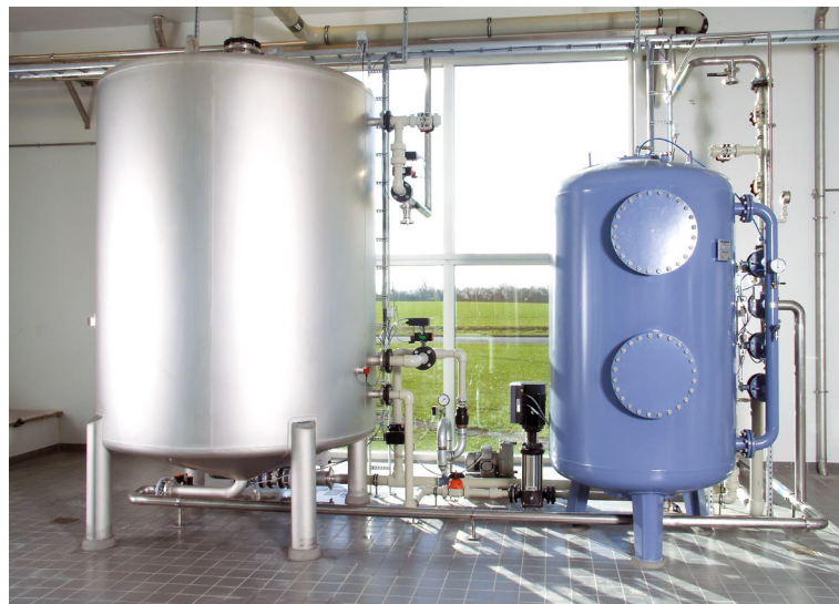
Odplynenie rozpustených plynov ako sú agresívny oxid uhličitý, metán a sírovodík je podmienkou optimálnej filtrácie. Foto: odplynenie a tlaková filtrácia v pivovare.