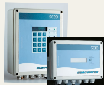
Riadiace panely SE10 a SE20.

Všetky riešenia riadenia a ovládania technológií sú prispôbené požiadavkám jednotlivých vodární alebo priemyslu. Ponúkame široký rozsah riadení – od jednoduchých programátorov po PLC riadenia, riešenia spájajúce riadenie, reguláciu a monitorovanie, lokálne sieťové systémy a systémy založené na GSM komunikácii.