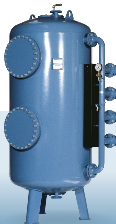
Automatický tlakový filter typ TFB Prietoky od 1 do 100 m 3 /h