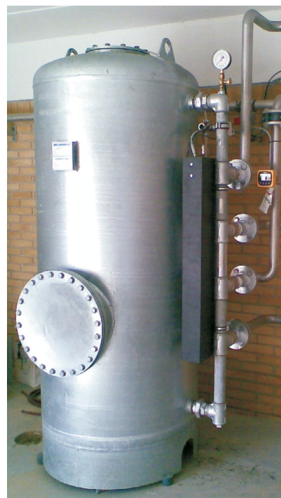
Odstraňovanie arzénu vo vodárni prostredníctvom adsorpcie. Riešenie obsahuje automatický tlakový filter typ NSB 170 inštalovaný za atmosférickými usadzovacími filtermi. Prietok: 12 m 3 /h.