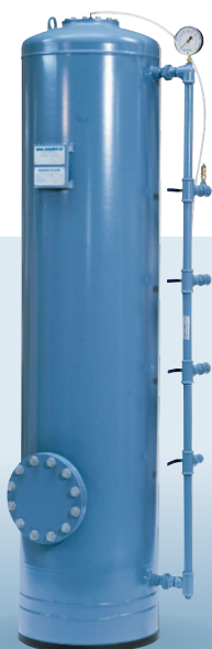
Manuálny tlakový filter typ NS Prietoky od 1 do 12 m 3 /h

Veľa zákazníkov nemá z praktických alebo iných dôvodov možnosť pripojenia sa na verejnú vodovodnú sieť. Technické riešenie pre nich je založené na rovnakých princípoch ako úprava vody pre veľké vodárne. Pre malé a stredné potreby pitnej vody je ideálnym riešením tlakový filter typ NSB.