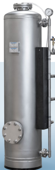
Automatický tlakový filter typ NSB Prietoky od 1 do 12 m 3 /h