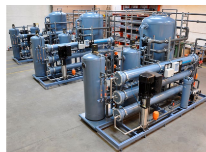
Rammemonteret anlæg til produktion af afsaltet vand til køling af Facebooks datacenter i Sverige.

Læs mere om vores løsninger indenfor teknisk vand, herunder procesvand, kedelvand, fjernvarmevand, kølevand og skyllevand på vores hjemmeside – silhorko.dk .