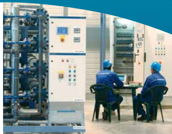
Preventívna servisná prehliadka úpravovne vody v závode na výrobu automobilov