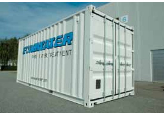
Kontajnerová úpravovňa vody – pripravená na použitie. K dispozícii je na prenájom alebo predaj.