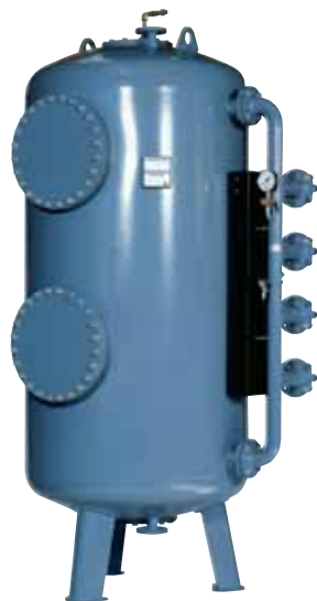
Tlakový filter typ TFB 14