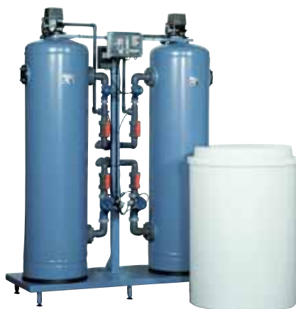
Zmäkčovač typ SMH 602